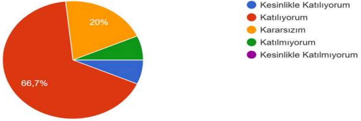
Şekil 3: Katılımcı Karar Alma Seviyesi

“Okulumuz temiz ve hijyeniktir” sorusuna anket çalışmasına katılan 41 öğretmenlerimizin %66,7’i Katılıyorum yönünde görüş belirtmişlerdir