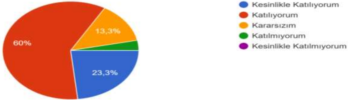
Şekil 2: Katılımcı Karar Alma Seviyesi

Okulumuzda görev yapmakta olan toplam 41 öğretmenin tamamına uygulanan anket sonuçları aşağıda yer almaktadır.